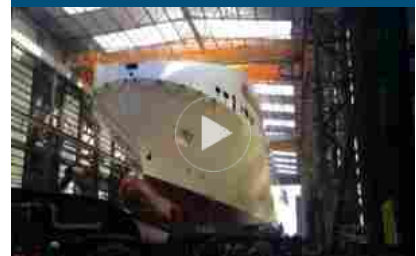
Il gruppo Onorato vara la più grande nave ro-ro del Mediterraneo