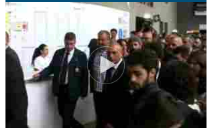
Fico al Salone del Libro: folla e selfie per uno stile popolare