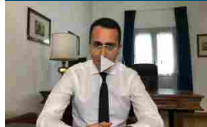
Di Maio: con Salvini passi avanti, ora un contratto di governo