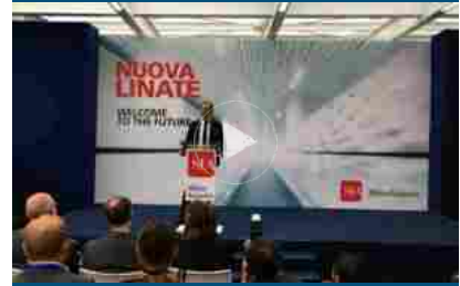
Il nuovo volto di Linate, concluso primo step restyling scalo