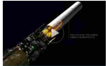
Philip Morris punta sempre di più su 'smoke free world'